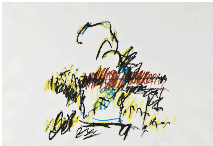
Abdelkébir Rabi', PP/37C, années 1970, Pastel sur papier.

comme marginal ni comme secondaire, mais comme un espace autonome et d'exercice méditatif où se concentre l'essentiel du processus créatif. L'exposition met en lumière cet exercice de dépouillement où chaque trace devient aveu, chaque hésitation devient révélation . Elle s'inscrit dans un mouvement global de retour vers les formes discrètes , répondant au besoin contemporain de retrouver le sens à travers le geste et le trait.