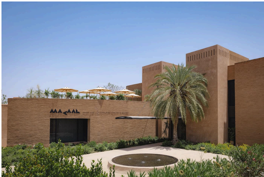
Vue de l'extérieur du MACAAL

L'Artist Room est un espace du MACAAL dédié à des expositions ponctuelles, individuelles ou collectives. Cet espace accueille des propositions artistiques contemporaines et explore les liens entre l'art et des disciplines telles que l'artisanat, le design ou la performance.