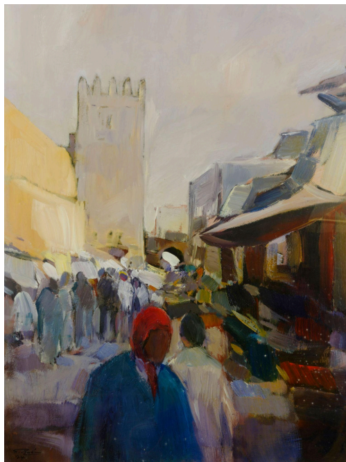
Abdelkébir Rabi', Scène de marché, 1974 Huile sur carton. © Collection Fondation Alliances - MACAAL

Le Musée d'Art Contemporain Africain Al Maaden (MACAAL) invite le public, le 19 décembre , à une journée portes ouvertes pour franchir le seuil du visible et pénétrer dans le laboratoire intérieur d'une figure majeure de la scène artistique marocaine. Avec l'exposition « D'un trait intime », le musée dévoile une facette méconnue et longtemps gardée secrète de l'œuvre d' Abdelkébir Rabi' : ses dessins, petits formats, et fragments. Ce corpus inédit constitue le noyau spirituel et fondateur de sa pratique, un art né d'un dialogue profond entre geste, mémoire et intériorité.